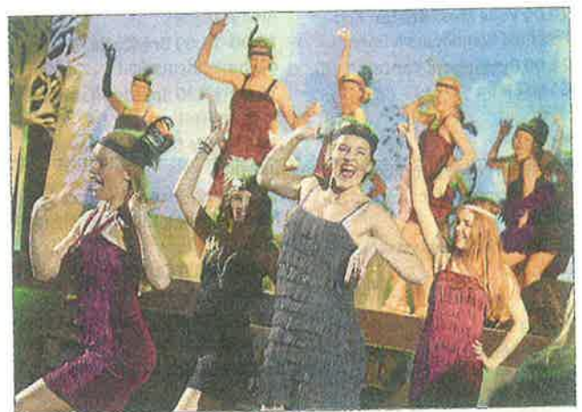
De brølende 20'ere - fest og farver før det hele brød sammen i 1929.