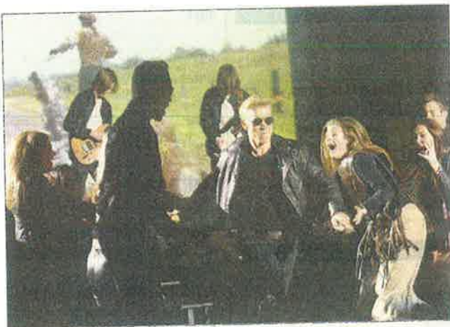
Rock til tiden. Flot udgave af "Born To Be Wild".

For eksempel de to "pedeller", som futter rundt og flytter rekvisitter. Det er med til at skabe rimeligt glidende overgange imellem de enkelte indslag.